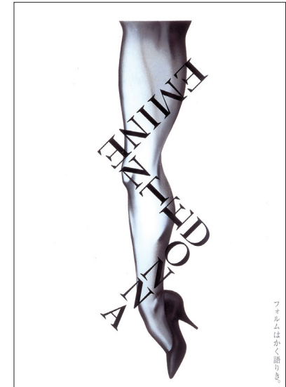
フェルムはかく踊りま。