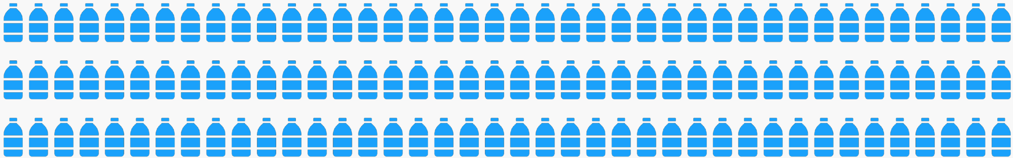
2L ペットボトル 150 本分